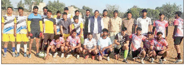
कनीना। प्रतियोगिता के दौरान उपस्थित खिलाड़ी।