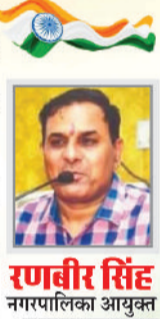
रणवीर सिंह नगरपालिका आयुक्त