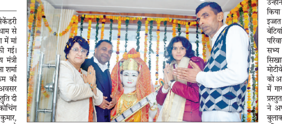
नारनौल। मां सरस्वती की प्रतिमा अनावरण अवसर पर मौजूद अतिथिगण।