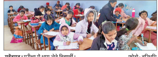
महेन्द्रगढ़। परीक्षा में भाग लेते विद्यार्थी।