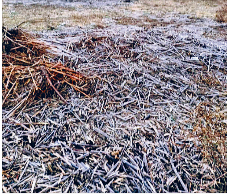
कनीना। गुढ़ा गांव में जमा पाला।

उत्तरी पर्वतीय क्षेत्रों पर बर्फबारी का सिलसिला जारी है। जिससे मैदानी राज्यों विशेषकर हरियाणा एनसीआर दिल्ली के साथ जिले में हाइड्रॉप देने वाली ठंड का प्रहार भी देखने को मिल रहा है