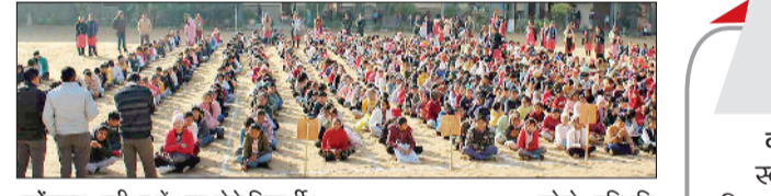
महेन्द्रगढ़। परीक्षा में भाग लेते विद्यार्थी।