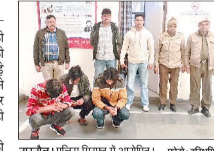
नारनौल। पुलिस गिरफ्त में आरोपित।