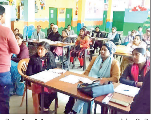
नारनौल। प्रशिक्षण कैम्प में मौजूद अध्यापक।