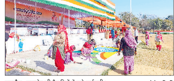
नारनौल। समारोह की तैयारियों में लगे कर्मचारी।