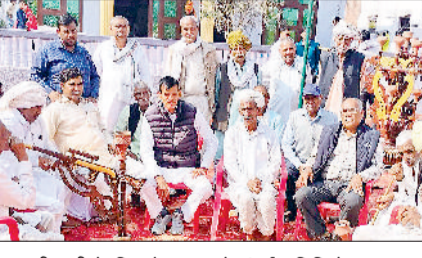
निजामपुर। नहरी पानी के लिए बैठक करते संघर्ष समिति के सदस्य।

नलवाटी-गुजरवाटी के गांवों में जोहड़ों का पानी सूखने से पशुपालकों की परेशानी बढ़ गई। पेयजल के अभाव में ग्रामीणों को पशुपालन करना मुश्किल हो गया तथा सिंचाई के अभाव में कृषि योग्य जमीन बिजाई से वंचित रहने लगी है। समस्या से जिला प्रशासन की मार्फत सरकार को अवगत कराया गया। इसके बावजूद स्थिति यथावत बनी हुई है। समाधान को लेकर नहरी पानी किसान संघर्ष